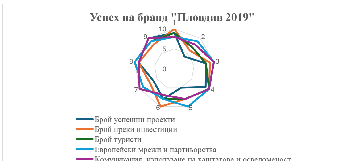
Фигура 4. Радарна диаграма за успех на бранд „Пловдив 2019“ (Фигурата е разработена от автора).

Фактите сочат, че за пет години броят на туристите се е повишил значително. Само един от експертите споделя, че Пловдив е средно успешен като бранд. Интервюираното лице има известни резерви към Критерий 1 и смята, че съществуват недостатъчен брой проекти, които се развиват след годината на титлата по програма „Наследство“.