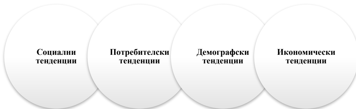
Фиг. 3. Тенденции в развитието на агротуризма чрез биопродукти в България